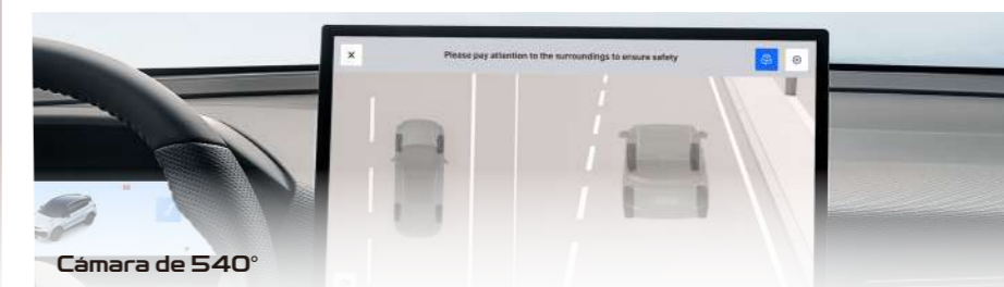
Cámara de 540°