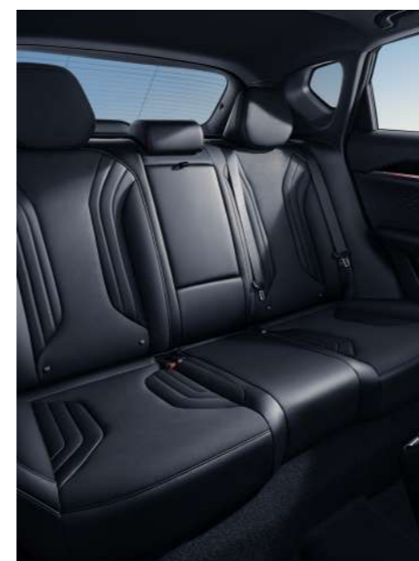
Asientos Traseros Confortables

Interior premium con pantalla de 14.6 pulgadas.